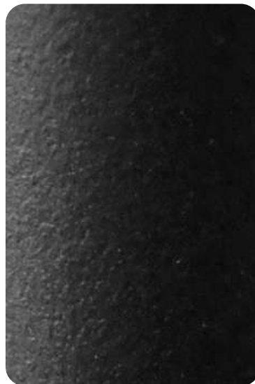
EN - Black