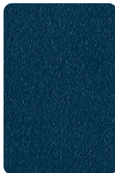
EI - Ocean blue