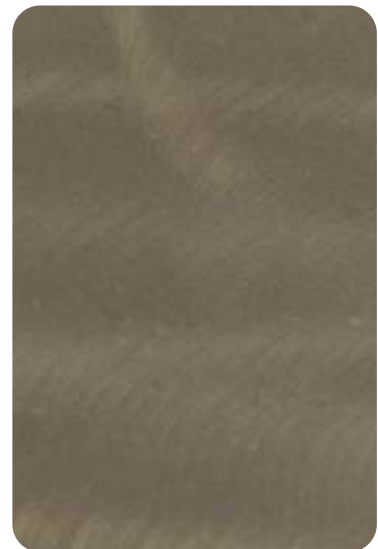
E5 - Industrial