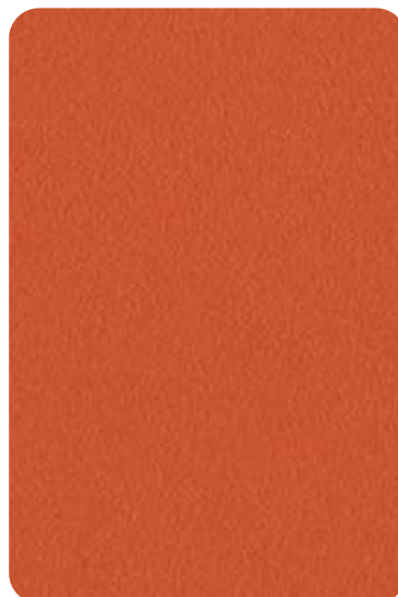
EA - Papaya orange