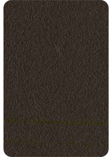
E6 - Brown