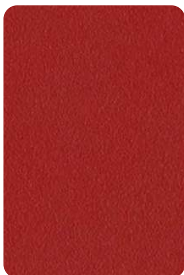
EQ - Cherry red