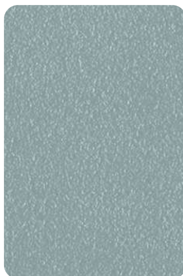
E0 - Light blue