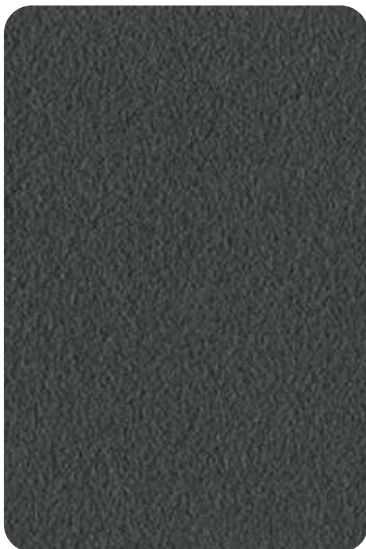
EG - Graphite