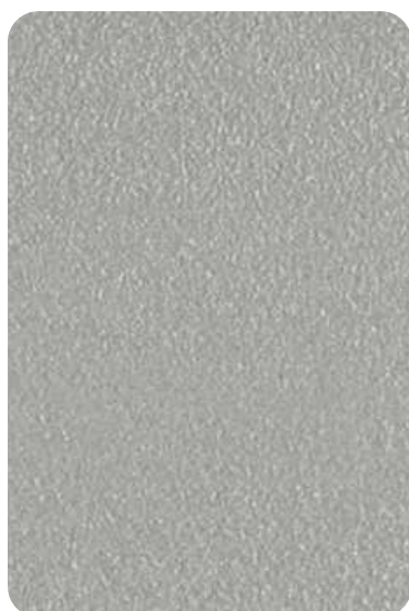
ET - Light grey