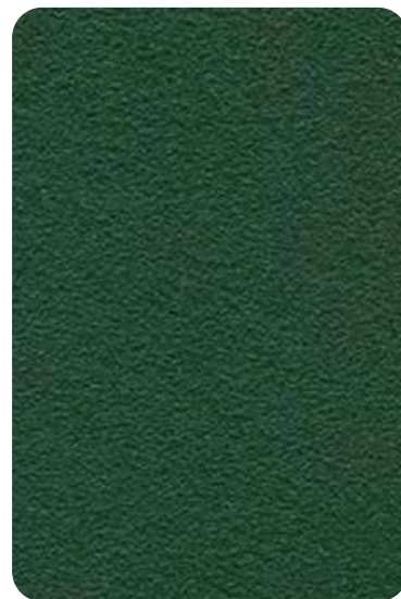
EL - Dark green