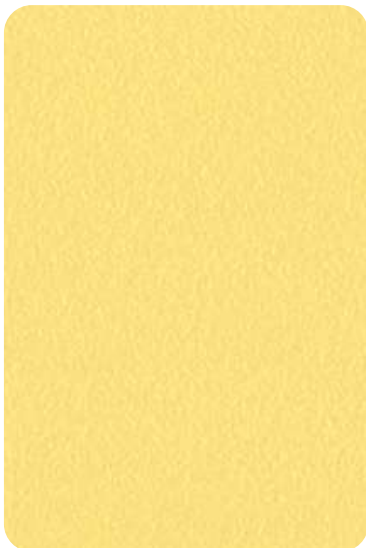
E4 - Pastel yellow