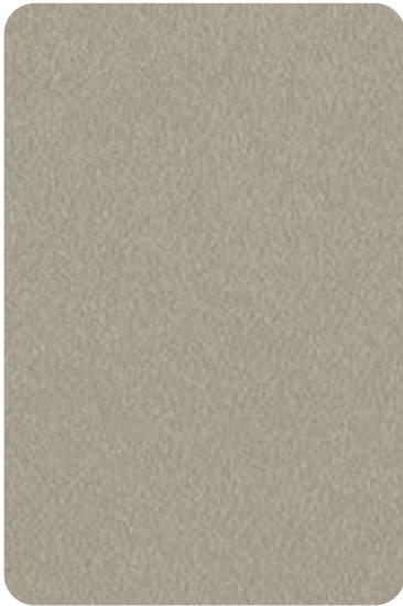
ES - Ash grey