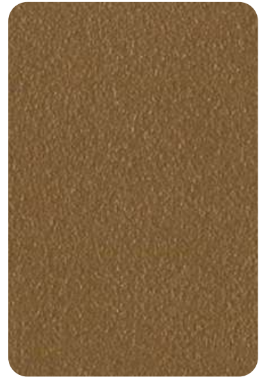
E2 - Bronze