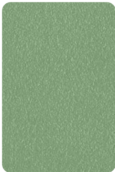
E9 - Sage green