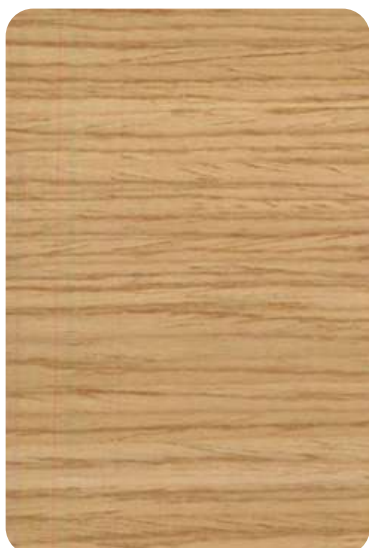
I52 - Stained natural oak