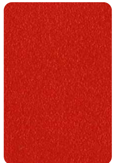
ER - Red