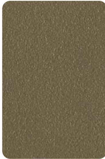
E3 - Fango