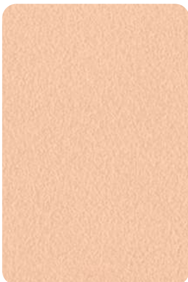
E8 - Facepowder pink