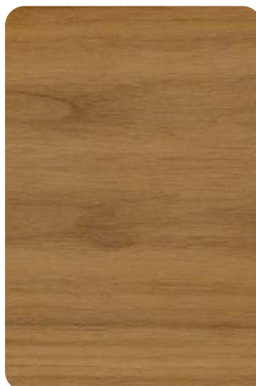
F24 - Stained flamed walnut