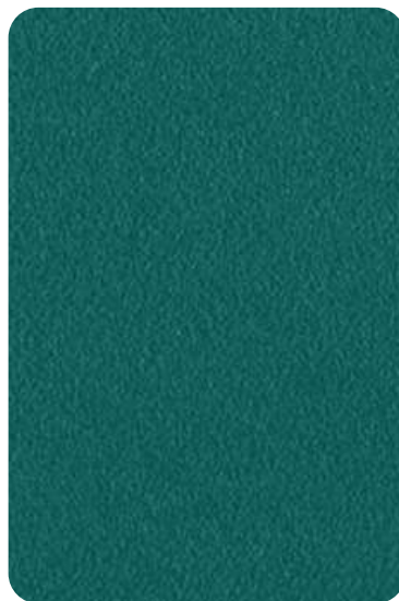
EJ - Pine green