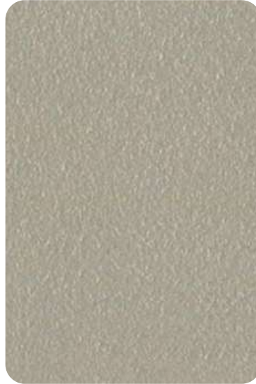
EC - Sand