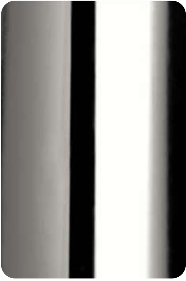
CC - Chrome