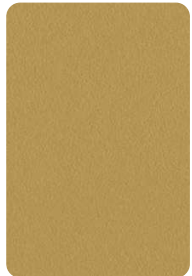
EO - Golden yellow