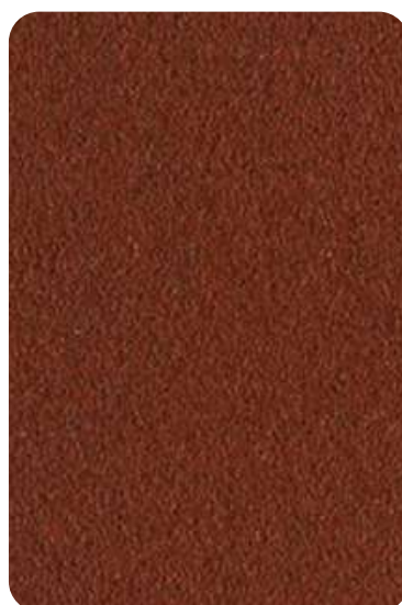
FP - Bulgaro red