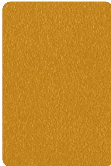
E7 - Ocher yellow